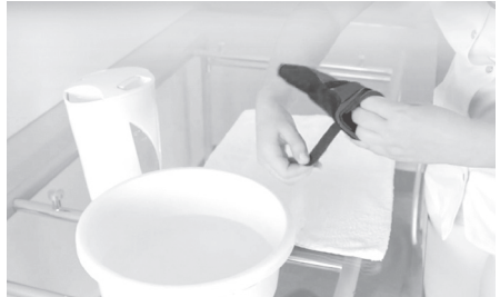
2. PL: Rozpinamy paski i rzepy ortozy. EN: Loose straps and Velcro tapes.