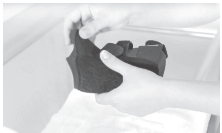
5. PL: Sprawdzamy czy orteza nie jest zbyt gorąca. Jeśli tak czekamy aż delikatnie ostygnie. EN: Check if brace is not too hot. If is still hot, wait until temperature will be safe for a body.