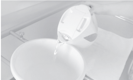
1. PL: Wlewamy gorącą wodę do pojemnika. EN: Pour boil water into the bowl.