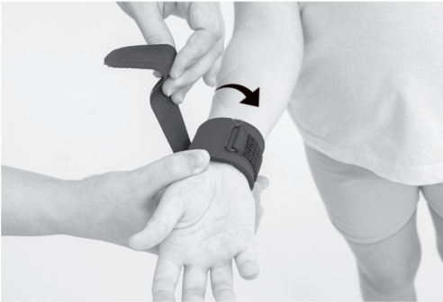
3. PL: Przepleć pasek przez klamerkę i zapnij na rzep. EN: Interlace the strap through the buckle and fasten with Velcro.