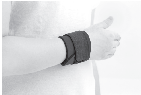
4. PL: Gotowy wyrób. EN: Product is ready to use.